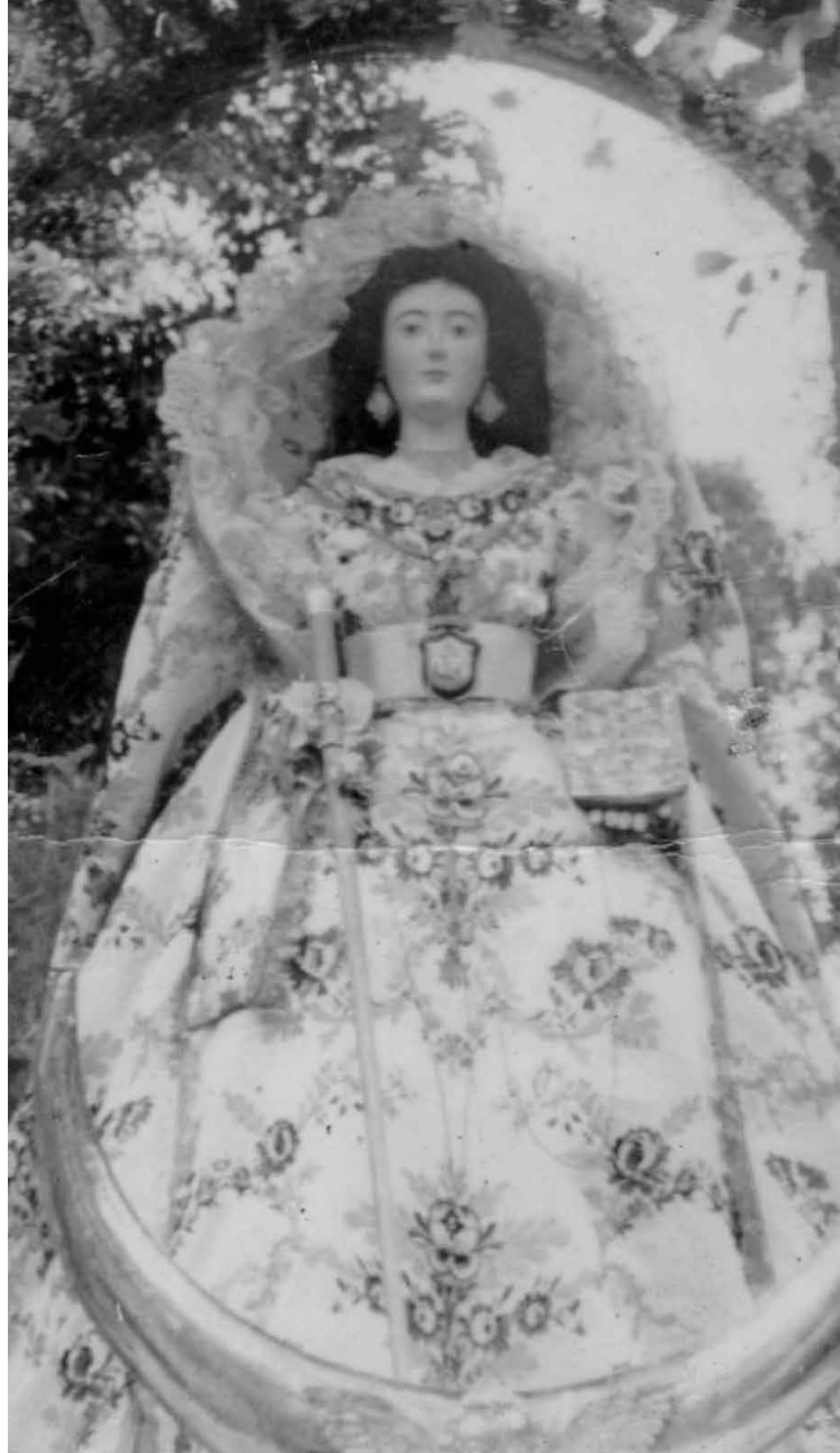
Imagen de Ntra. Sra. de La Encarnación, con el bastón de mando, Alcaldesa Honoraria y perpetua.

La presea fue ejecutada por el orfebre Luis Vispé en su taller del vecino municipio de Guía de Isora. La pieza representa la unión del pueblo de Adeje con su devota imagen de la Encarnación. La corona de tipología imperial, destaca por su canastillo de amplias proporciones que contiene una serie de símbolos propios de la villa, como el escudo de la misma, y otros elementos que fueron relacionados también con la simbología mariana. La obra de orfebrería fue donada por la Cooperativa de Taxis de Costa Adeje.