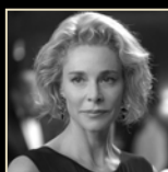
BELÉN RUEDA PREMIO DE HONOR