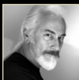
RICK BAKER PREMIO DE HONOR