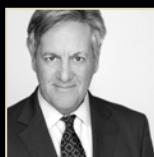
DAVID NAUGHTON PREMIO DE HONOR