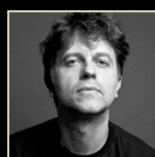
JUAN CARLOS FRESNADILLO PREMIO S.S. VENTURE