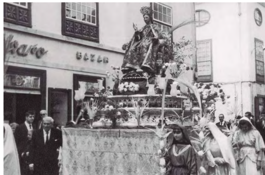
PROCESIÓN DEL CRISTO PREDICADOR, MEDIADOS DEL SIGLO XX

Para ilustrar este proceso de aggiornamento o renovación de la Semana Santa lagunera acompañamos una crónica sobre su celebración en 1931, y dos programas de los actos y procesiones a celebrar, correspondientes respectivamente a los años 1931 y 1934, publicados todos ellos en la prensa local. A destacar la descripción de la procesión Magna en 1931, por detallar el orden de los pasos y la asociación que acompañaba cada uno de ellos.