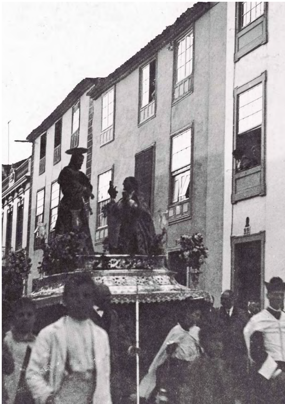
PROCESIÓN DE LAS LÁGRIMAS DE SAN PEDRO, PRIMERA MITAD DEL SIGLO XX - Colección Ricardo González.