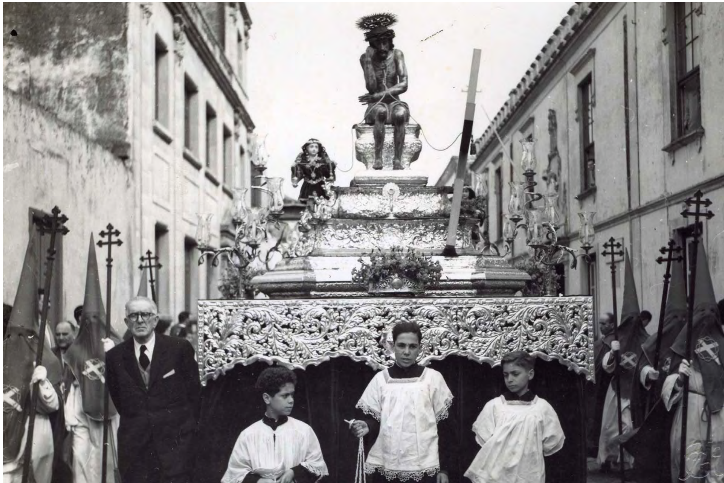
PASO DEL SEÑOR DE LA HUMILDAD Y PACIENCIA, MEDIADOS DEL SIGLO XX