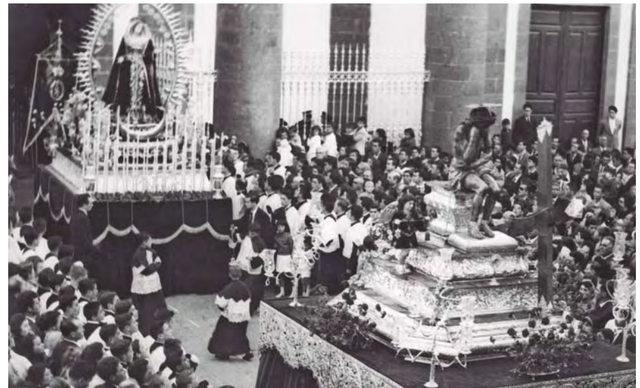
SALIDA DE LA PROCESIÓN MAGNA DESDE LA CATEDRAL, SEGUNDA MITAD DEL SIGLO XX

SAN FRANCISCO. Por la mañana, a las cuatro de la madrugada, sermón, saliendo según costumbre la procesión del Santísimo Cristo de La Laguna, acompañado de su Venerable Esclavitud.